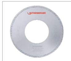
Trennscheibe Diamant für Guss/SML No. 56706