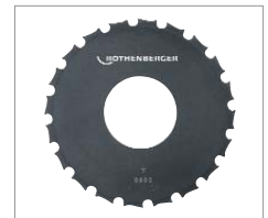
Sägeblatt Kunststoff No. 56703