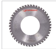
Sägeblatt HM TCT Universal No. 56704