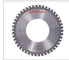
Sägeblatt Keramik für Edelstahl No. 56705